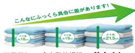
天日干し 全自動乾燥機 乾太くん