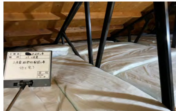
厚 200mm のグラスウールを隙間無く施工。屋根からの熱を居住スペースに伝えないように天井裏でストップ！