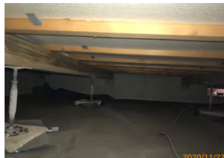
冬場は床がとても冷たく毎年しもやけになっていた。薄っぺらい断熱材が入っていた。