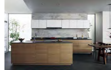
リフォームに最適! リフォーム シンプル且つモダンな Lクラス