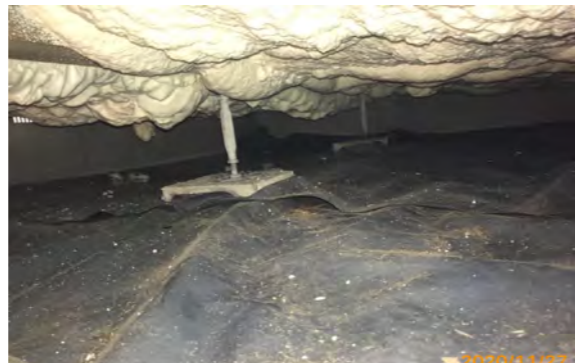
厚 85mm 程度に断熱材のアイシネンを吹付。隙間を作らない断熱材のおかげで、お施主様も「冬に床がつめたくない！」と大喜び♪