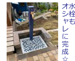
水栓 ヤレに 完成☆