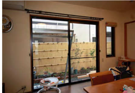
アルミの窓枠と単板ガラスのサッシは冬場の結露が凄く、寒かった。夏も日差しが入り込んで蒸し暑く光熱費がかさんでいた。