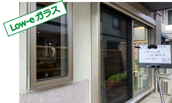
樹脂の窓枠とペアガラスのサッシを取付。断熱性能がUPし、冬場はヒーターひとつだけでも十分暖かくなった。