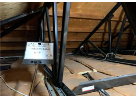
数十年前の断熱材は隙間だらけでベラベラで、断熱材としての機能をほとんど果たしていたなかった。