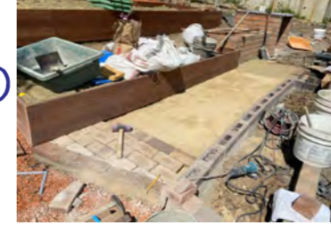
アプローチ 敷レンガ