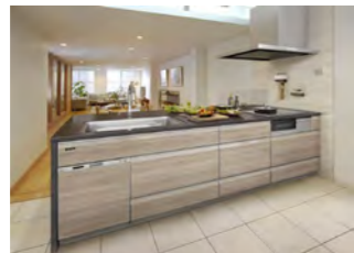
今人気の石材風のデザインが唯一選べる ブレデンシア